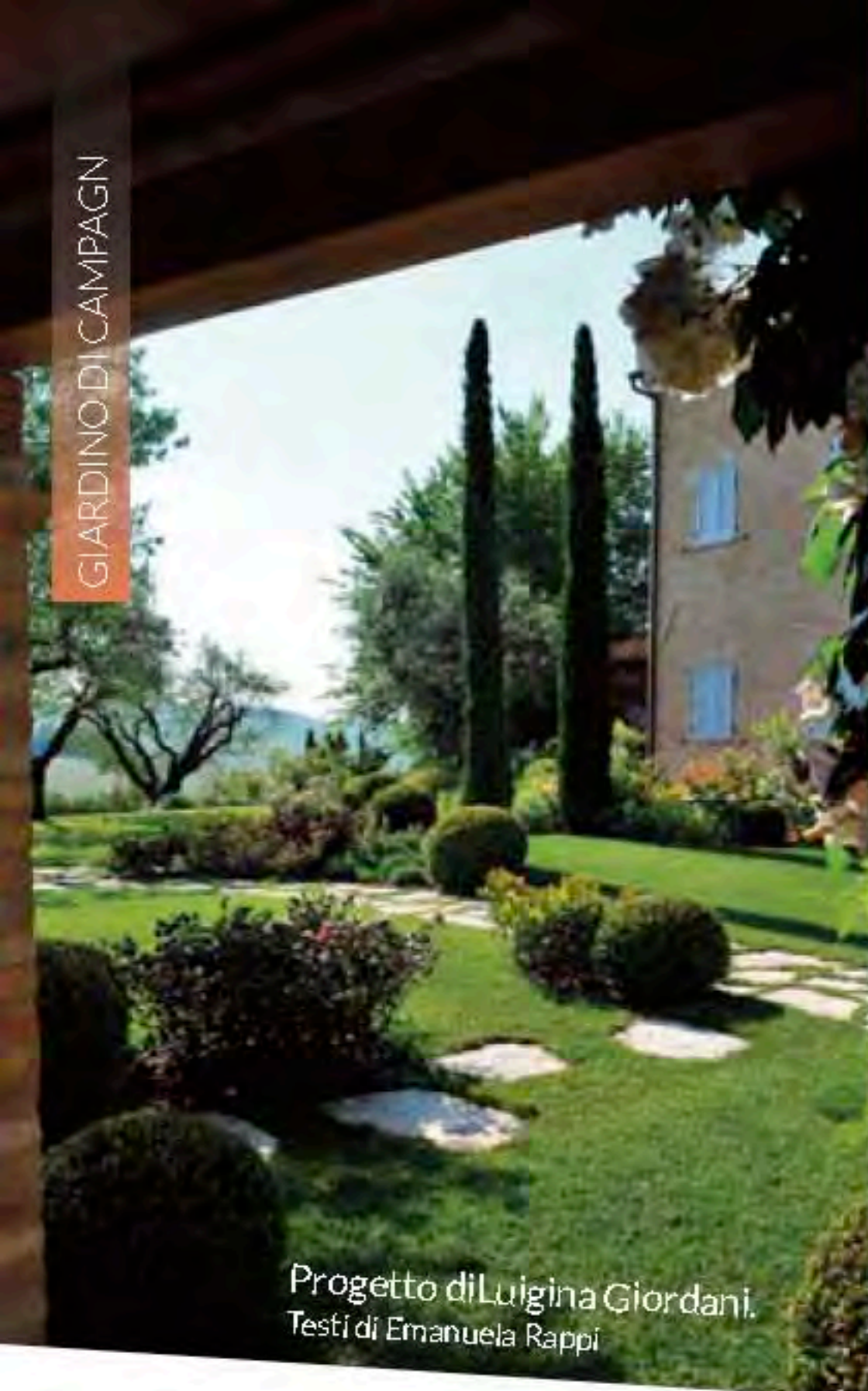
Progetto di Luigina Giordani. Testi di Emanuela Rappi