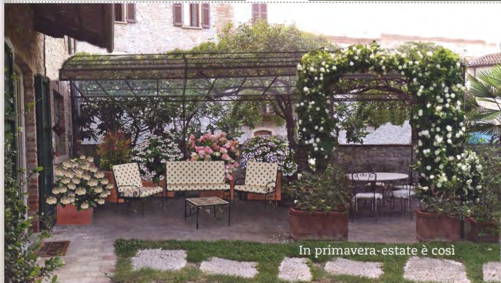
In primavera-estate è così

La lanterna. Per illuminare le sere d'estate, regalando a questo spazio all'aperto una romantica atmosfera, niente di meglio di una lanterna, nella quale inserire una o più candele. Questa, di Il Fanale, è realizzata in ferro anticato e vetro, misura 23x23x58 cm e costa 1.035 €.